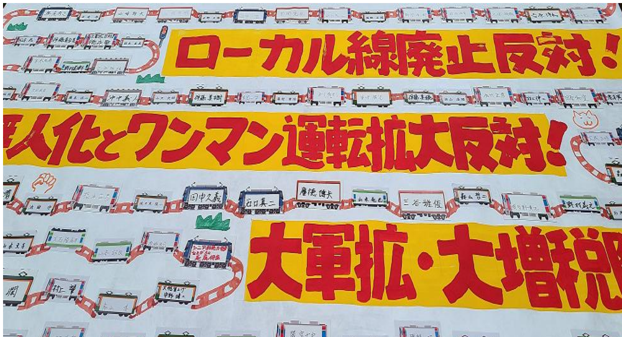
今年も17,000円の賃上げを求め、組合員や共闘の仲間と国民春闘を取り組みました。