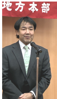
② 日本共産党岡山県委員会 岡山県議会議員 ・ 森脇 久紀様