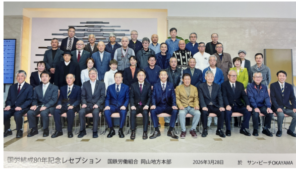
国労結成80周年記念レセプション 国鉄労働組合 岡山地方本部 2026年3月28日 於 サンピーチOKAYAMA